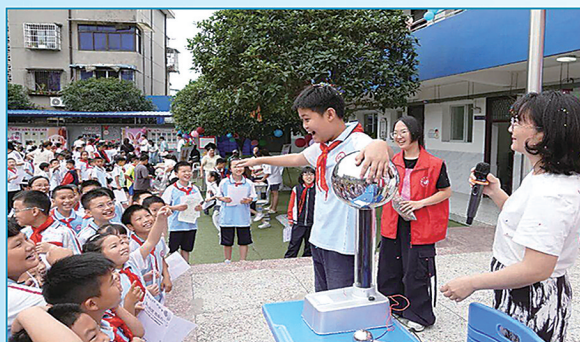
乐山高新区第一小学学生参与物理光电实验。