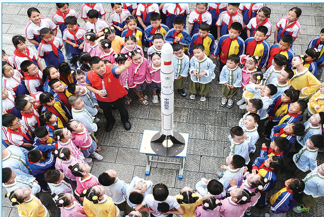
达州市科协科技辅导员为达州市通川区实验小学学生讲解航天知识。