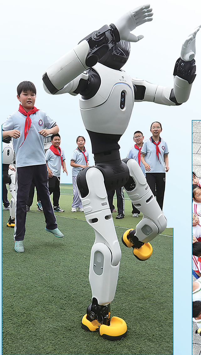
苏州市平江实验学校分校学生与机器人进行趣味互动。

今年5月24-31日是第二十六个全国科技活动周,主题为“奋进‘十五五’科技谱新篇”。全国科技活动周多维度宣传展示我国在基础研究、前沿技术、未来产业、重大工程等方面取得的成果,让公众近距离感受来自科研院所、高校、企业的科技创新。活动期间,全国多地开展科普进校园活动,通过展览展示、科学体验、参观研学、短视频讲解等方式,让孩子们近距离接触科学、感受科技魅力。