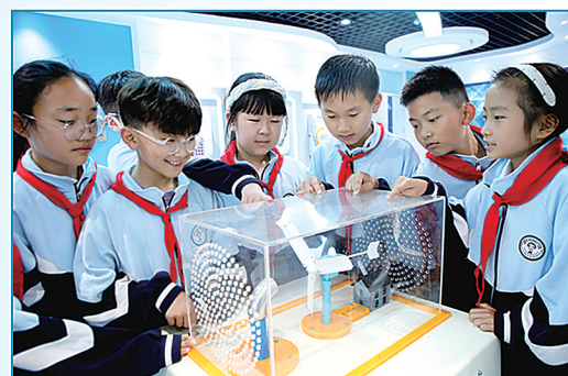
连云港市院前小学学生在校科技馆观看“风力发电”装置。