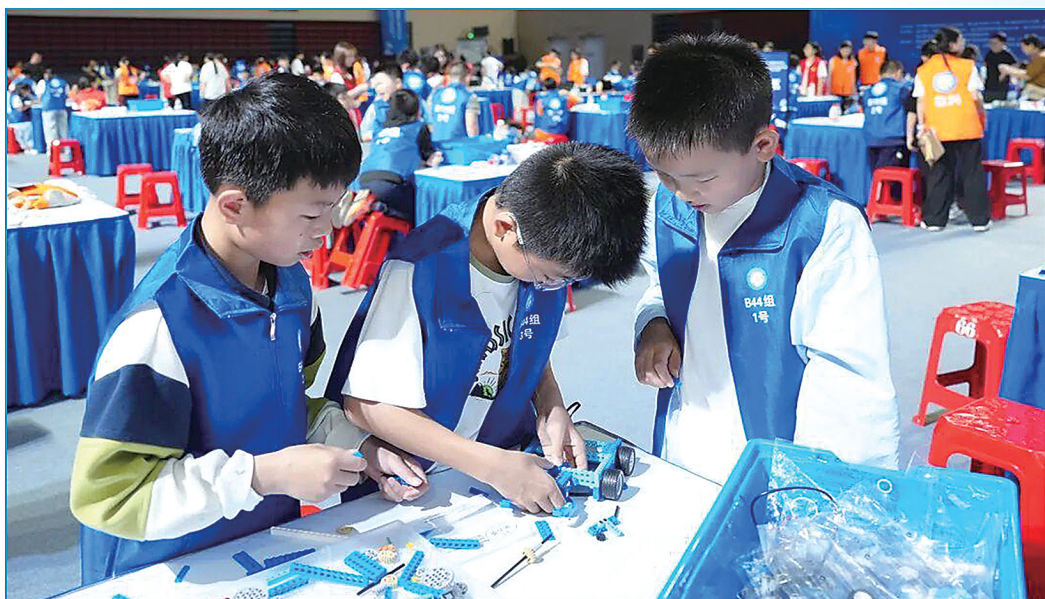
在湖南湘江新区科技活动周暨首届社区(村)机器人挑战赛中,小学生选手竞技机器人结构搭建。