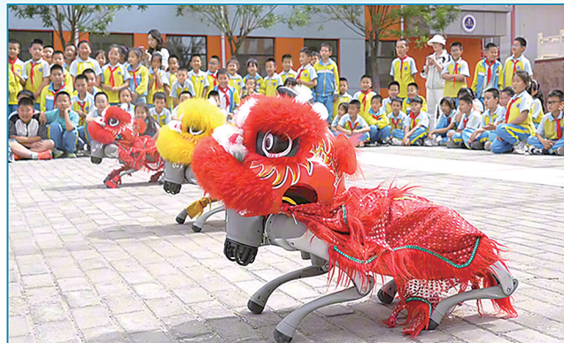
阿拉善高新区第二小学学生观看机器人表演。